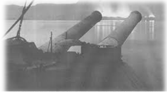
Dünya'nın En Büyük Savaş Gemilerinden "Invincible" Cernobil'den Yıkılır

19 Şubat'ta başlayan bombardımanlarda İtilaf Donanması'nın başında Amiral Carden bulunmaktaydı. Carden, yapılan bu bombardımanların Boğaz'daki tabyalara zarar vermediğini, boşuna cephanelik harcamakta öteye gitmediğini üst makamlara iletmiştir. Fakat üst makamları ikna edemeyen Carden geçirdiği bir sinir krizi sonucu görevden alınarak yerine Amiral de'Robeck Birleşik Filo Komutanlığı'na getirilmiştir. Amiral de'Robeck komutasındaki Birleşik Filo, destek ve lojistik gemileriyle birlikte toplam 103 parça gemiden oluşmaktaydı. Bu filonun amacı; Merkez tahkimatları ve seygar bataryaları susturmak ve sonrasında mayın gemileri ile Boğaz'daki mayınları temizleyerek İstanbul yolunu açmaktır.